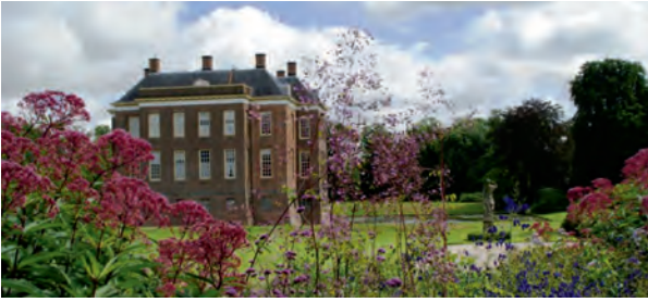
Kasteel en tuin Middachten.