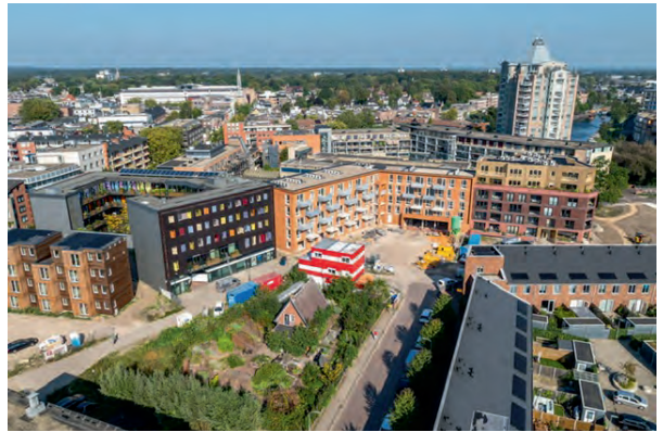
Het Havenpark: een snippertje groen van Groei & Bloei tussen nieuwe bebouwing in de binnenstad.

Riolering. Door de nieuwbouw vlak bij de moestuin is het riool, dat onder een gedeelte van de moestuin loopt, toe aan vervanging. De uitvoerder heeft aangegeven dat de noordzijde van de moestuin, waarop de kas, de vijver, de insectenhôtels, een moestuinbed, kunstwerken, fruitbomen en een groot deel van het voedselbosje staan, op de schop moet. Dat wij dat erg vervelend vinden staat buiten kijf. Alle moeite die we hebben gedaan gaat verloren. Dit deel van de moestuin moet vrijgemaakt worden. Dit is in veel opzichten een verlies, en we moeten proberen te redden wat mogelijk is. Redden wat er te redden valt – dat is uiteindelijk wat we de komende maanden gaan doen.