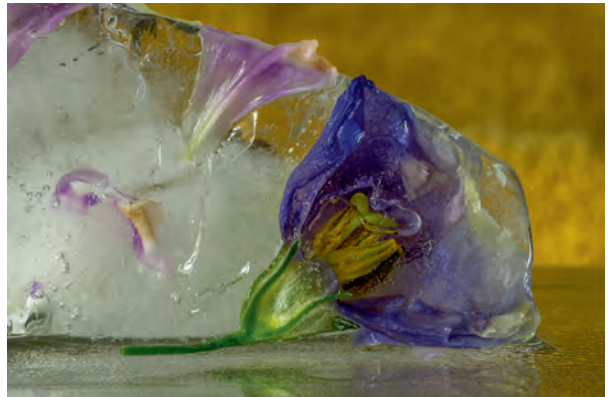
In ijs gevangen.

De combinatie van zijn fotografisch inzicht en zijn passie voor de natuur staan garant voor een boeiende avond, die u zeker niet mag missen!