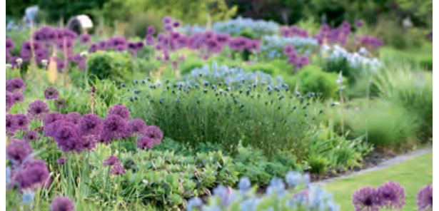
De Vlinderhof.

we de tuin van Polhuis, een moderne tuin met veel bijzondere planten. Ook gaan we voor de pauze nog wandelen door een moderne tuin in Leeuwarden. Na de pauze bezoeken we tuinen in Noord-Holland, Limburg en Friesland. Ook een aantal van de in het verleden beroemde Zeeuwse tuinen worden bezocht. We besluiten de tuinenreis met een bezoek aan de 'Vlinderhof' in Utrecht.