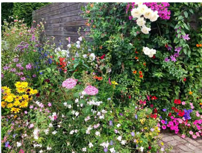
De minituin van Steve L'Homme

Mijn tuin is gesitueerd op een parkeerplaats die bereikbaar is tussen twee woningen. De taartpunt-achtige vorm van de tuin heeft een oppervlakte van 3 m 2 met een weelderige zomerse en kleurrijke uitstraling. Een perfecte mix van de juiste hang- en klimplanten en planten in de grond resulteren in het kleurenpalet van een kunstwerk. De tuin is klein, maar je bent niet in een oogwenk klaar. Door de grote variëteit van de beplanting kan je jezelf erop betrappen dat je een hoop toch niet gezien hebt. 'Je ziet wat je niet ziet' zeg ik vaak tegen bezoekers van mijn tuin.