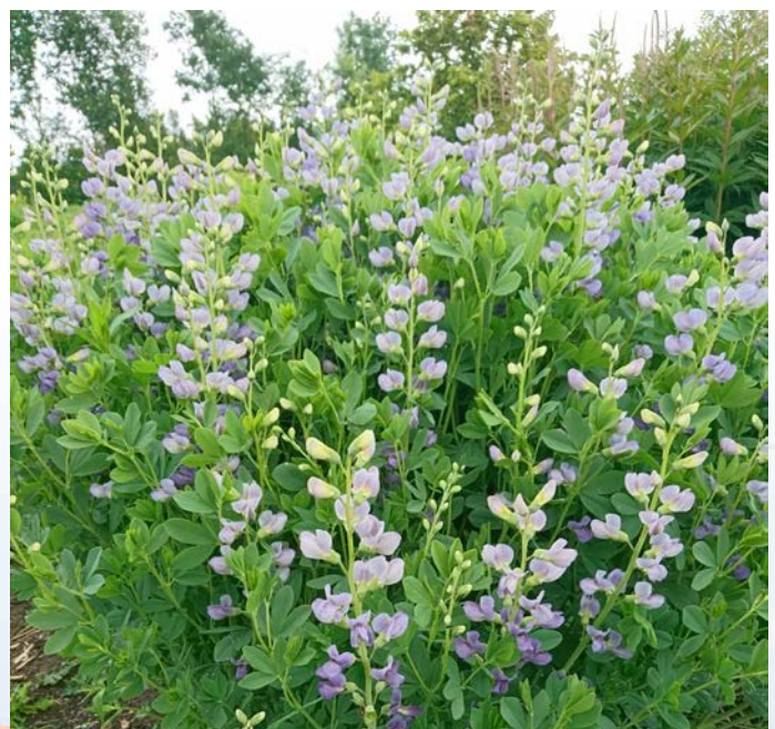
Baptisia Mien

Na de pauze zal ik de nieuwe planten laten zien die we komend jaar hopelijk kunnen verkopen. We zijn druk met het vermeerderen van allerlei leuke nieuwe soorten en we verwachten dat die in de loop van het jaar voldoende gegroeid zijn om ze te kunnen aanbieden. Ieder jaar verandert het assortiment van de kwekerij. Er komen steeds nieuwe soorten bij die we afgelopen jaren hebben uitgeprobeerd en waarvan we denken dat het een toevoeging van ons assortiment is. Sommige van deze planten staan al een aantal jaar in onze kwekerijtuin en zullen u misschien bekend voorkomen, anderen zijn echt helemaal nieuw. Deze nieuwigheden kunnen altijd op veel belangstelling rekenen en ik stel ze graag aan u voor.