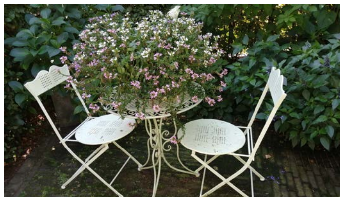
Welkom in de tuin!

Ook dit jaar organiseert de afdeling Apeldoorn weer een Open Tuinenweekend en wel op zaterdag 17 en zondag 18 juni. Op de website apeldoorn.groei.nl onder het kopje Terugblikken>Open tuinen weekenden kunt u lezen hoe leuk dat vorig jaar was.