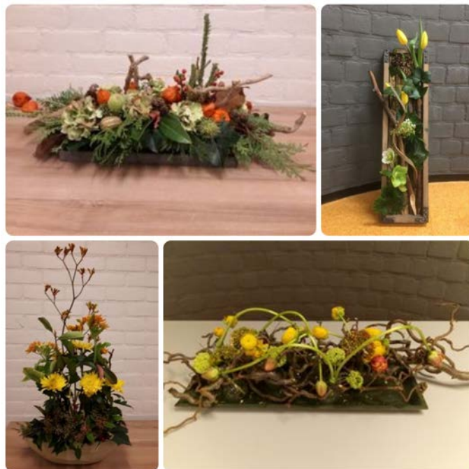
Voorbeelden van schikkingen (foto's docenten bloemschikken)

Informatie en opgave: Dicky Lammersen tel. 055-3011912. Of via de website: apeldoorn.groei.nl onder het kopje Activiteiten.