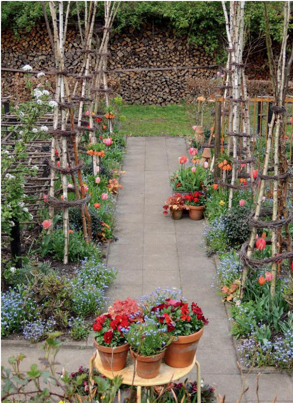
De Pluktuin als Flower Heaven.