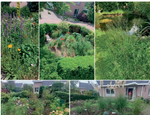
Tuin van de familie Reiss, Homerusstraat 41 Apeldoorn.

Op 1 november, tijdens het 2e Klimaatcafé, werd de winnaar bekend gemaakt en dat is de fam. Reiss uit de Homerusstraat 41 in Apeldoorn geworden.