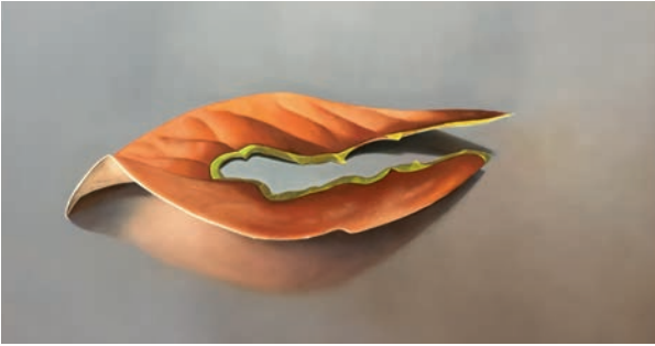
Laurierblad. Schilderij van Anita ten Wolde

Zo valt er heel wat te bewonderen en te genieten in de natuur en in je eigen tuin, als je maar goed om je heen kijkt!