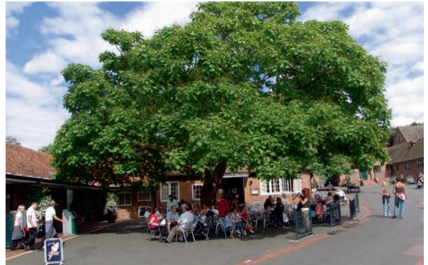
Mensen zoeken schaduw op een zomerse dag in een stenige omgeving.