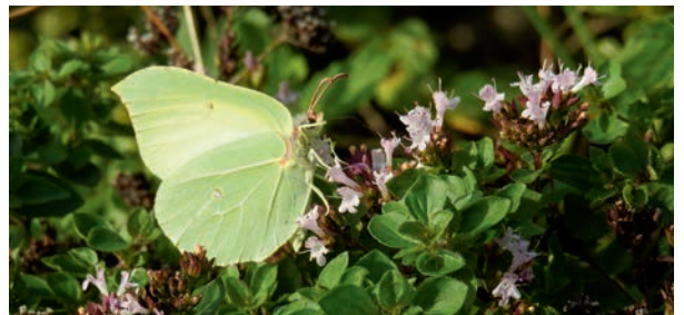
Verwondering over de pracht van de citroenvlinder.

Ze krijgen de kneepjes van het vak aangereikt door ecooloog Luc Hoogenstein die dit al eerder in zijn eigen stadstuin deed en daar het boek 'Mijn 1000 soorten tuin' over schreef. Hij verzorgt vier excursies in de eigen tuinen. Elke maand zal op de websites van Groei & Bloei Apeldoorn en IVN Apeldoorn een update verschijnen over het project.