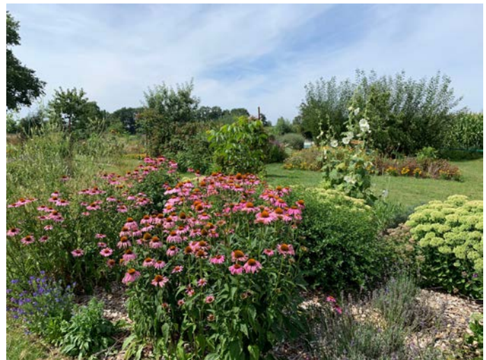
Natuurtuin de Gatherhof in Vaassen