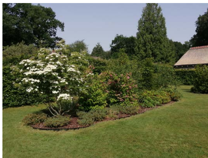
Weidsheid in de tuin bij Eva Ariens Kappers.