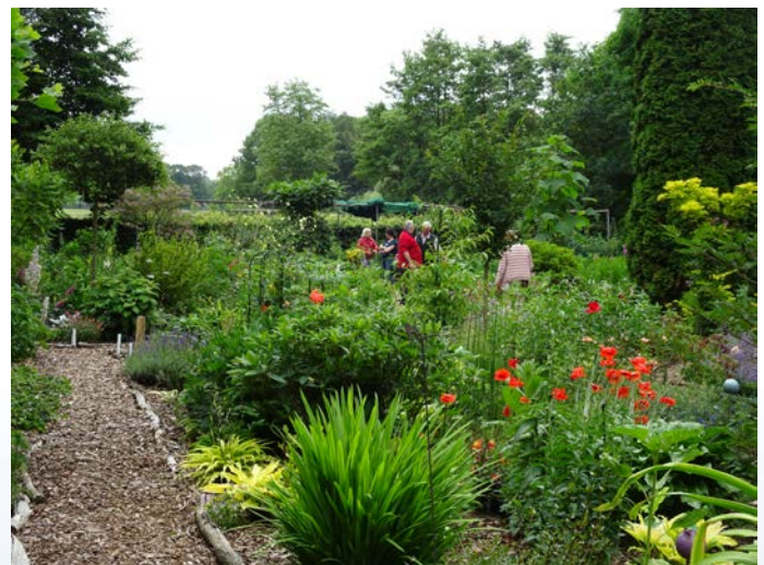
In de hostatuin van Hans Luiten.