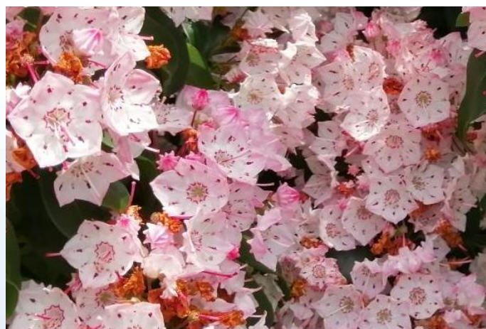
Wonderschone Kalmia in de tuin bij Wim Arentsen.