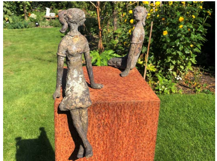
Kunst in de tuin bij Woppy van der Velde.

Door het organiseren van Open Tuinen weekenden wil Groei & Bloei Apeldoorn de verbinding tussen de leden versterken. Er worden in de tuin vaak nieuwe contacten gelegd. En bij het zien van al dat tuinenthousiasme besluiten bezoekers soms om ook lid te worden.